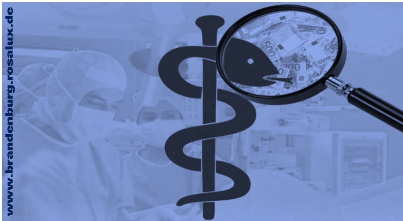
Abbildung: Filmplakat „Der marktgerechte Mensch“, 2019 (Ausschnitt)